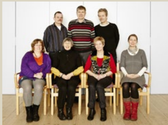
Gimming Sogns menighedsråd 2012-2016:

Det nye menighedsråd er gået i gang med opgaverne. På vores hjemmeside ligger der oplysninger om de enkelte medlemmers funktioner og kontaktdata. I de kommende numre af bladet vil vi præsentere medlemmerne lidt nærmere.