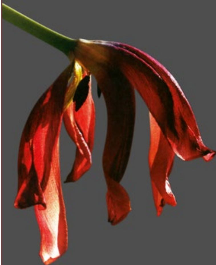
Foto: Rene Hansen (som gengivet i "Påseketanker" af Gurli Vibe Jensen. Det danske Bibelselskab, 2006)