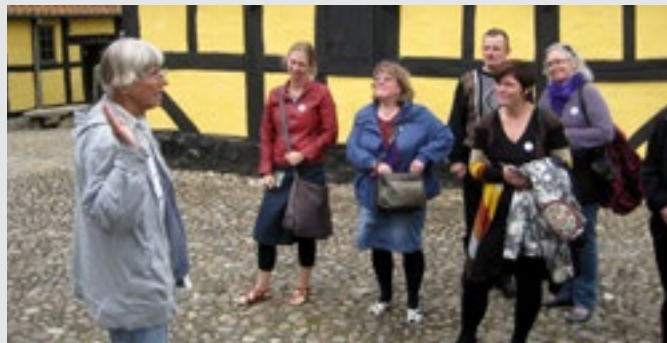
Foto fra Gimming Menighedsråds studietur 2012, der bl.a. gik til Glud Museum.