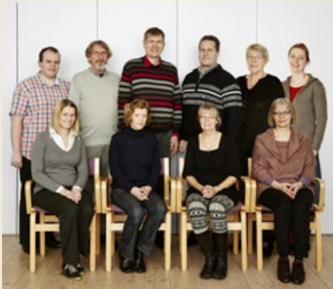
Dronningborg Sogns menighedsråd 2012-2016:

Det nye menighedsråd er gået i gang med opgaverne. På vores hjemmeside ligger der oplysninger om de enkelte medlemmers funktioner og kontaktdata. I de kommende numre af bladet vil vi præsentere medlemmerne lidt nærmere.