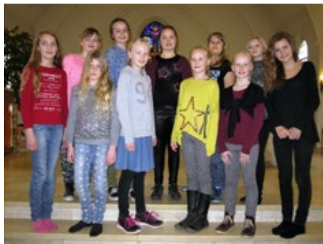
Aspirantkoret, april 2014

Aspirantkoret ved Dronningborg Kirke er for piger og drenge i alderen 10-15 år. Eneste krav: at du kan lide at synge sammen med andre. Kammeratskab og korsang går hånd i hånd. Du lærer - og du ler. Du bliver fortrolig med kirke og salmebog, dåb og nadver mv.