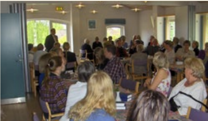
Sognegården var fyldt, næsten til bristepunktet, under jubilæumsreceptionen den 11. maj. Forhåbentlig sker det samme den 23. juni.