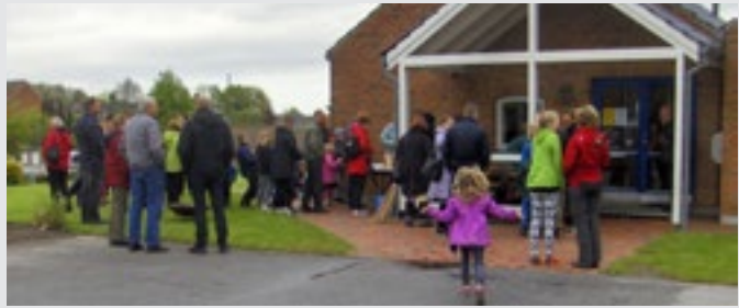
Efter forestillingen var der grillmad til alle, som trodsede regn og kolige vinde.