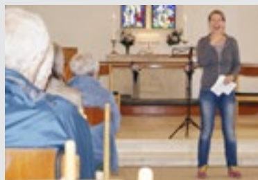
Sognepræsten bød velkommen til koncerten - og hun udstrålede den stemning, der hurtigt bredte sig, da Stones og Elvis blandede sig med Brorson og Grundtvig, Matthæus, Johannes og Esajas.

Koncerten åbnede med bløde Rolling Stones-toner fra kirkens orgel: She's a Rainbow . Koncerten var bygget op over en række temaer, som hver især blev ”illustreret” ved en collage af oplæsning fra Bibelen og salmebogen vekslende med kendte sange fra beat-perioden omkring 1970.