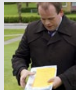
Dronningegeen fik et par ord og et kirkeblad med på sin videre vækst.