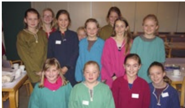
12 kjortelklædte disciple er klar til at "gå ud i alverden"

Vi slutter forløbet palmesøndag, søndag d. 29. marts, kl. 10 med en familiegudstjeneste, hvor minikonfirmanderne på forskellig vis vil medvirke. Alle er velkomne!