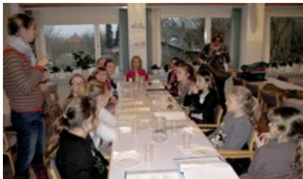
12 trøtte disciple er samlet til måltid efter dagens vandring

Medlemmerne af aspirantkoret er 10-15 år og medlemmerne af kirkekoret 12-18 år. Begge kor øver onsdag eftermiddag, aspirantkoret kl. 15.30-16.30, kirkekoret kl. 16.30-18.