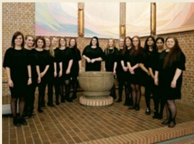
Skt. Andreas Kirkes Pigechor fotograferet ved kirkens døbefont