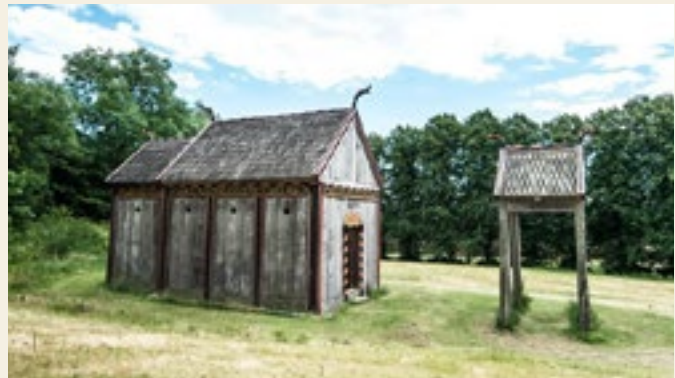
Rekonstruktionen af stavkirken fra Hørning med tilhørende klokkestabel er en af museets mange perler.

Eftermiddagskaffen indtager vi i museets café, hvorefter man kan gå på opdagelse i det enorme museum på egen hånd, eller man kan gå en tur til Moesgaard Museums lille stavkirke. Stavkirken er lavet på baggrund af fund i Hørning Kirke, lige uden for Randers.