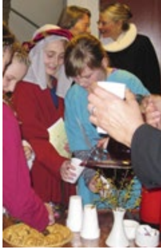
Kirkekaffe i forbindelse med gudstjenesten palmesøndag 2015, hvor minikonfirmanderne opførte rollespil. Kaffen var suppleret med saftvand til de unge – udklædte - disciple!

Hvis du har tid og lyst, så henvend dig på kirkekontoret.