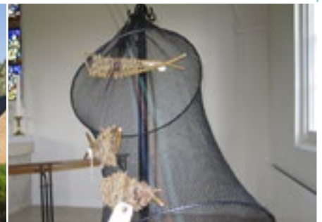
Pinselig kirkepynt, læs side 7