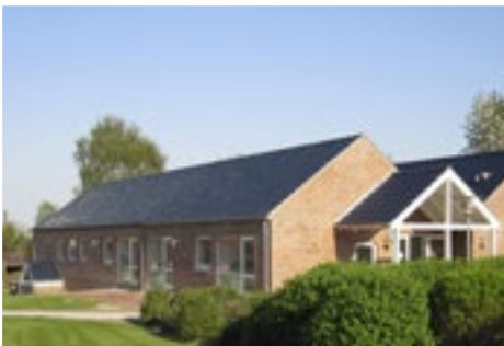
Sognegården i brug efter ombygning, læs side 4