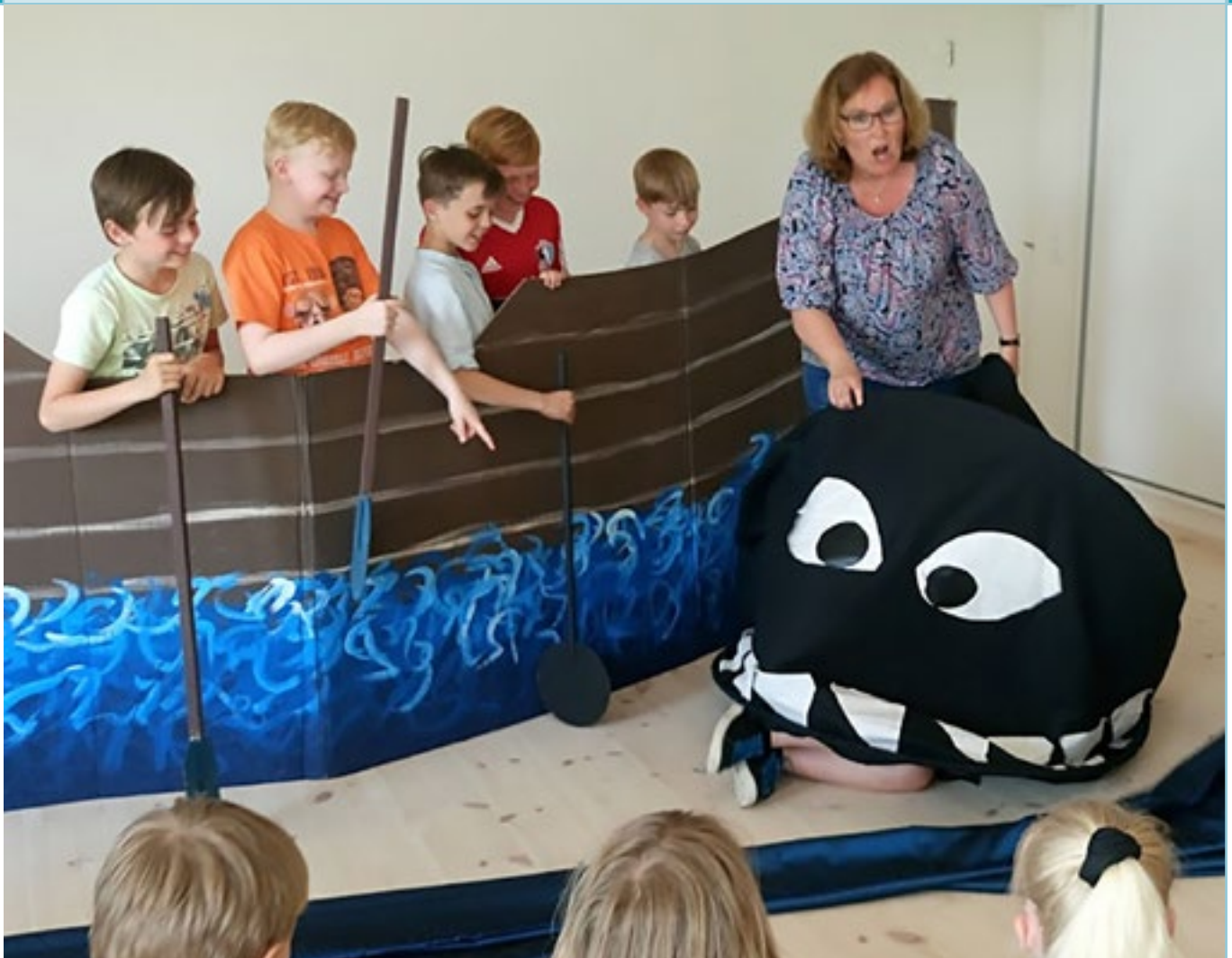
Rismølleskolens 3. klasser på besøg i sognegården, læs side 7