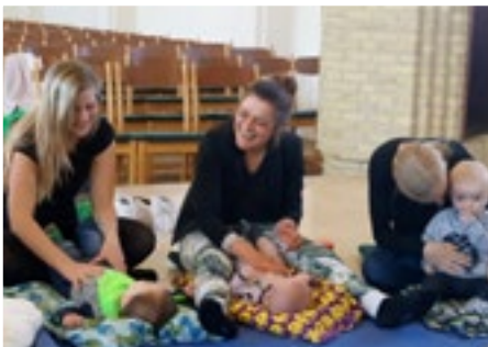
Babysalmesang - nyt hold i juli, læs side 7