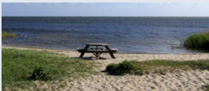
Ringkøbing Fjord – Stranden ved Gammelsgn Kirke.