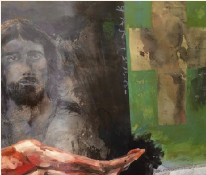
Et af de 14 værker, der indgår i koncerten.