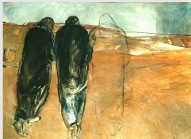
Janet Brooks-Gerloff "Vandringen til Emmaus" (1992)