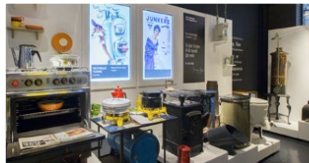
Fra udstillingen ”Da farmor var ung”, GASmuseet, Hobro.

Tilmelding til kirkekontoret senest den 1. juni. Pris: 100 kr.