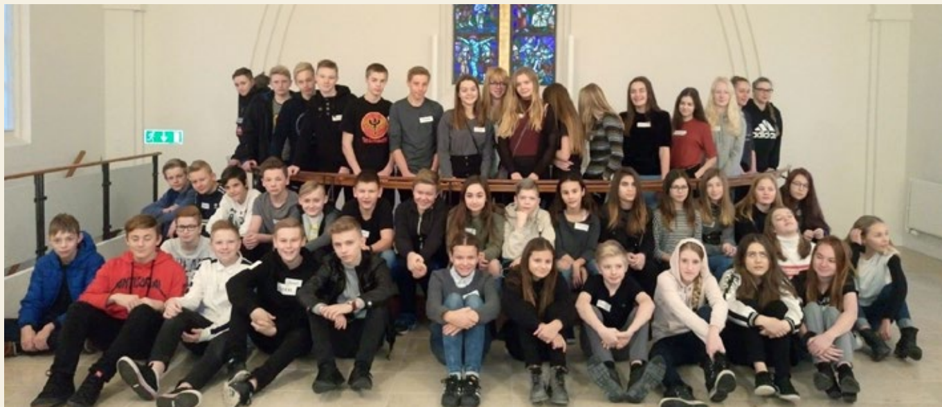
Konfirmationsforberedelsen er i gang. Her er de tre hold fra 7.V, 7.X og 7.Y på Rismølleskolen samlet efter kend-din-kirke-stafet i Dronningborg Kirke.