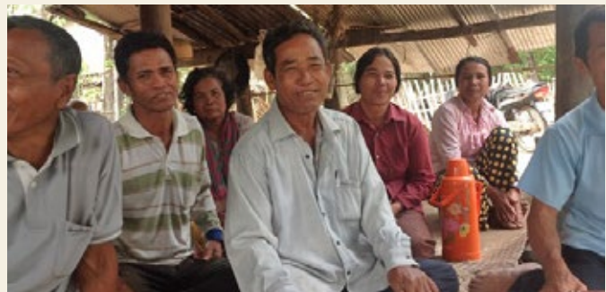
Gudstjeneste - Cambodja.