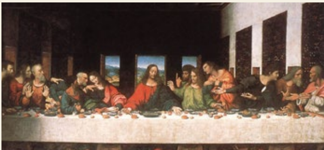
Leonardo da Vinci "Den Sidste Nadver" (1498).